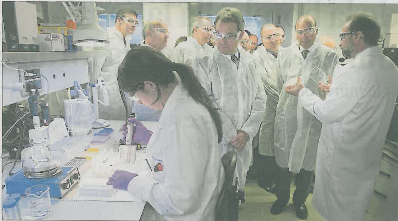
Artur Mas va inaugurar aquesta setmana el nou centre d'R+D del grup farmacèutic al Parc Científic

Els fàrmacs de marca aporten només el 30% de les vendes del grup