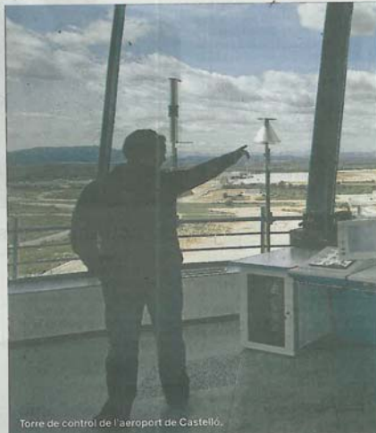
Torre de control de l'aeroport de Castelló.

En el terreny de les pràctiques concretes, la responsabilitat fiscal s'apunta com un pas cap a aquesta consolidació. «S'han d'orientar els esforços al compliment de les obligacions fiscals i al descobriment dels incompliments. És essencial lluitar contra les ocultacions i el frau. Una cultura de la tributació àmplia