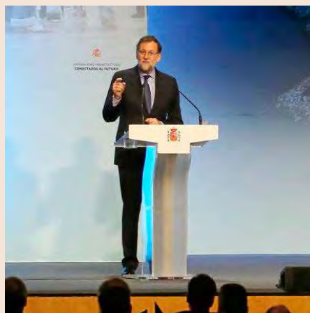
RAJOY ANUNCIA INVERSIONES DE 4.200 MILLONES El presidente del Gobierno, Mariano Rajoy, anunció el martes en Barcelona una inversión en las infraestructuras catalanas de 4.200 millones de euros hasta 2020, que se repartirán entre Cercanías y el Corredor Mediterráneo.